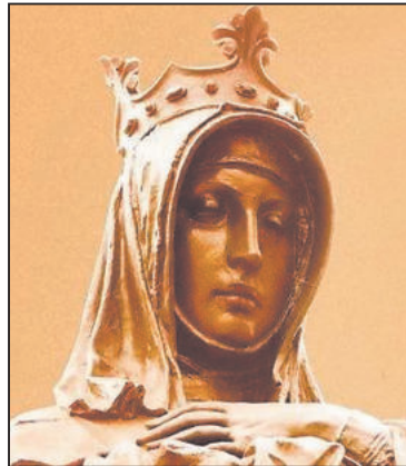
SVATÁ ANEŽKA ČESKÁ, patronka Čech, chudých a trpících.

■ 130. výr. narození Pavel Bořkovec, skladatel a pedagog (*10. 6. 1894,