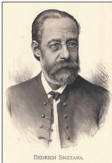
BEDŘICH SMETANA na obraze Jana Vilímka.

■ 850. výročí úmrtí Vladislav II., český král z rodu Přemyslovců, našim zemím zajistil rozkvět. (*asi