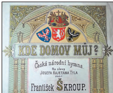
VLASTENECKÁ hymna Kde domov můj má 190. výročí. Zdroj: net

Dětem a jejich rodičům přejeme šťastný život. -lko-