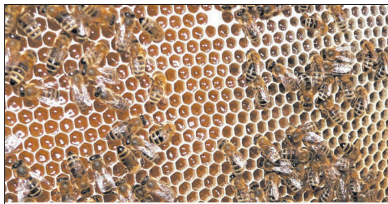
NOVOMĚSTSKÉ Slavnosti medu sladce ukončí léto.