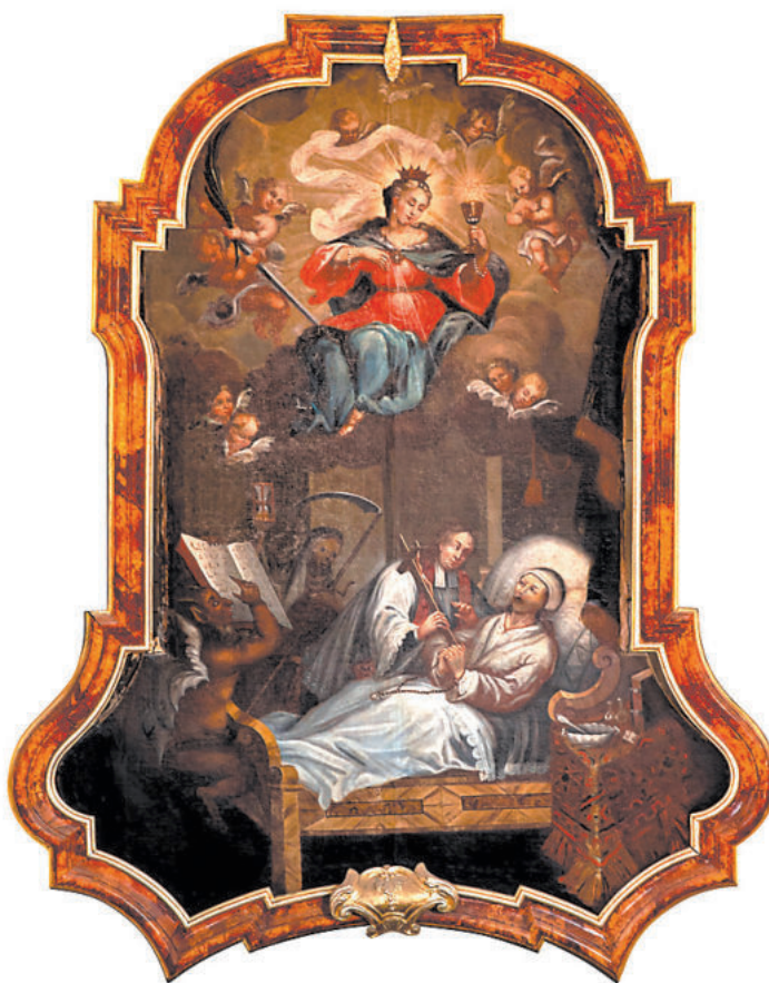
UMÍRÁNÍ. Barokní člověk toužil po dobré smrti v obklopení rodinou a s duchovním doprovázením kněze. Patronkou umírajících na dobovém obraze je svatá Barbora.