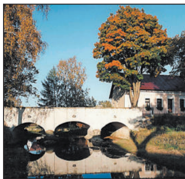
KAMENNÝ Valentův most spojuje od roku 1856 moravskou a českou stranu obce.

V okolí obce v minulosti fungovaly čtyři skelné hutě. Ta nejstarší s názvem Mariánská huť tavila tabulové sklo již v roce 1604. Později přibrala výrobu skla dutého a barevného. Sklárna pracovala až do roku 1914 a vyučil se tu např. zakladatel