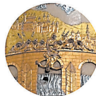
DETAIL reliéfu svržení sv. Jana Nepomuckého do Vltavy, který známe z barokní kazatelny na Zelené hoře. Věděli jste, že ve Žďáře je kopie? Originál (vpravo) najdeme v kostele naší tajné obce.