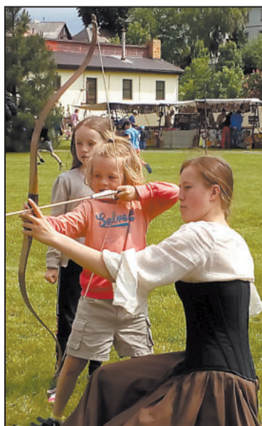
V KVĚTNU Farčata ožijí Festivalem dětských historických her.

Čeká je střelení z praku, vyřezávání lodiček nebo píšťalek, kluci mohou odpalovat špačky a honit obruč, děvčata zase plést věnečky z