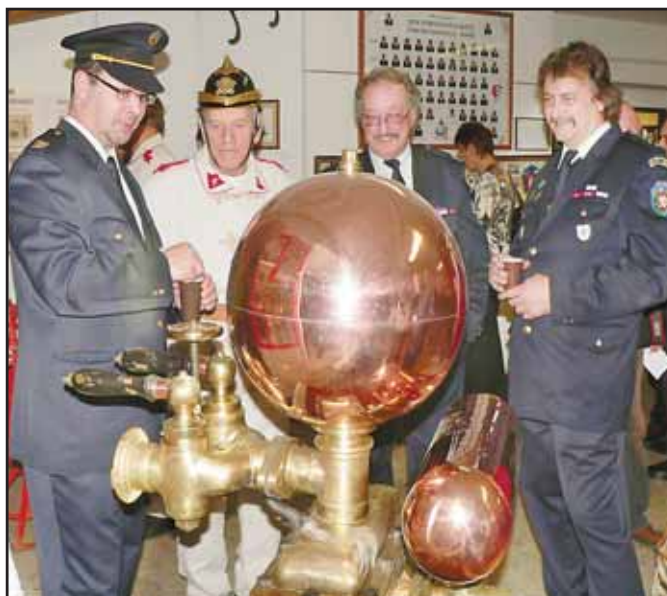
VYČÍDĚNÁ historická technika je chloubou klášterských hasičů. Snímek z vernisáže výstavy.

Od 19.00 do 23.00 Prohlídka současné hasičské techniky, výzbroje a výstroje na nábreží Sázavy pod Tvrzí.