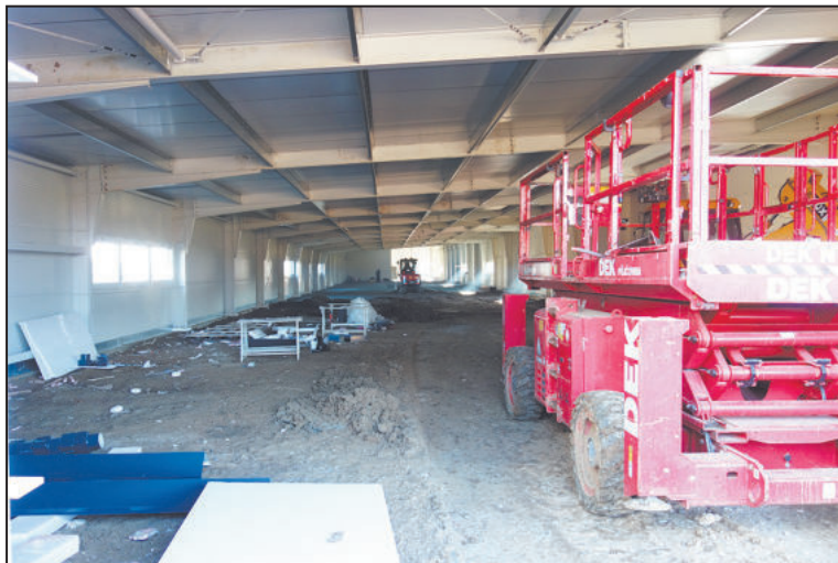
VÝSTAVBA atletického tunelu v Třebíči finišuje.