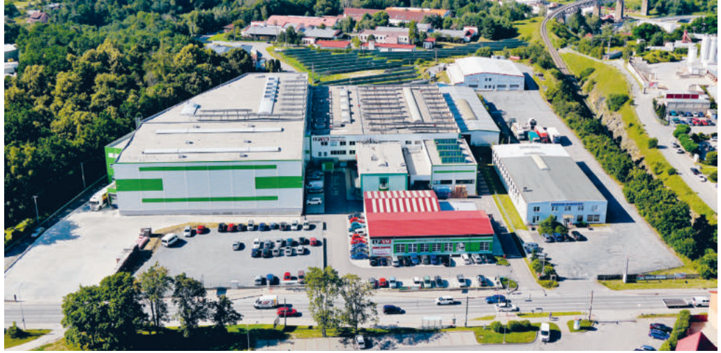
Celkový pohled z dronu na areál firmy.

Ve výrobě používáme ty nejmodernější technologie. Jsme tým nadšených profesionálů a špiček v oboru.