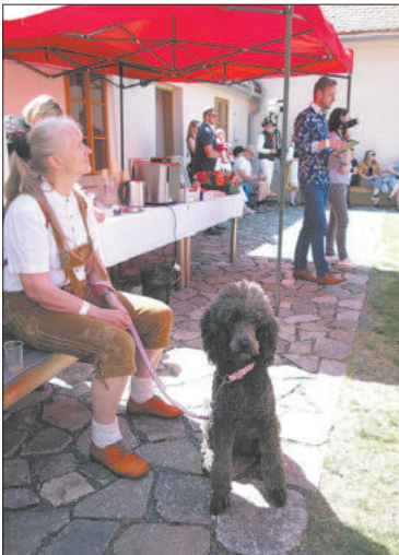
RAKOUŠTÍ přátelé přijeli s obrovitým černým pudlem.