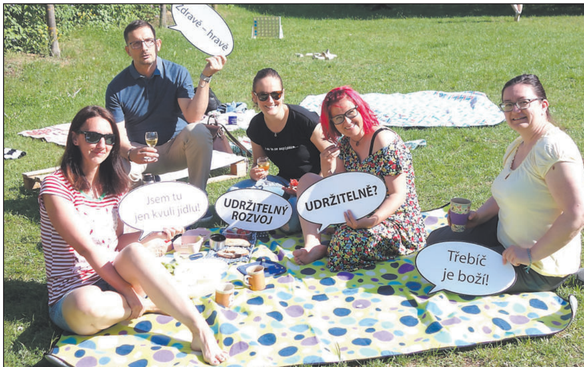
FÉROVÁ SNÍDANĚ. V Třebíči se konala v červnu na zahradě Centra volného času Hrubínka. Má za cíl ukázat zájem o životy pěstitelů kávy, kakaa nebo banánů v dalekých zemích Afriky, Asie a Latinské Ameriky.

Záchytné parkoviště a cvičná plocha pro autoškoly v ulici Hrotovická v Třebíči se začalo budovat na začátku června. Výstavba potrvá do konce září. Vyžádá si zhruba 16,5 milionu korun. Vznikne tam asi 170 parkovacích míst. -zt-