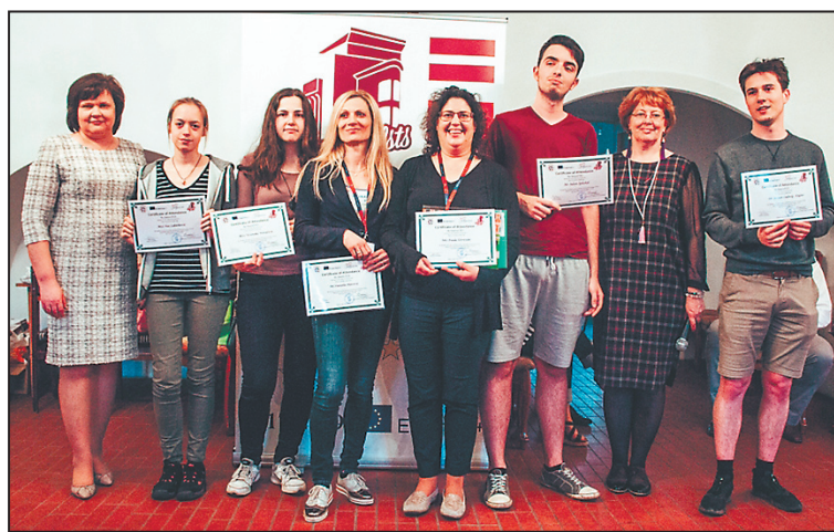
STUDENTI Katolického gymnázia cestovali.

V pondělí byl na gymnáziu v Jelgavě slavnostně zahájen tento týden plný aktivit, poznávání nových kultur a navazování přátelství. Byly zde představeny všechny týmy zapojené do projektu, a to tým z Portugalska, Itálie, Německa, České republiky, dva týmy z Turecka a tým z Lotyšska. Následovala prezentace o Lotyšsku, o vzdělávacím systému v této zemi, o Jelgavě a o tamějším gymnáziu. Za zmínku jistě stojí, že je výuka v současné době provozována na zámku, kam byla přesunuta kvůli rekonstrukci původní budovy gymnázia. V odpoledních