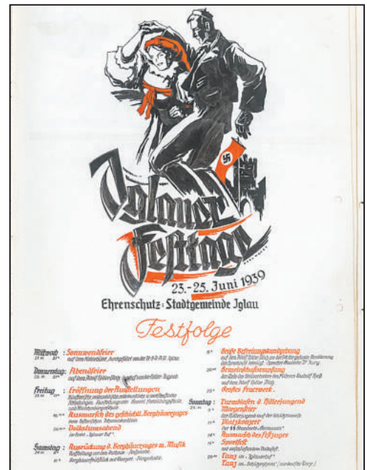
POZVÁNKA na městské slavnosti z roku 1939.

„Nechybí ani upoutávky na hlavní události, jako byly městské slavnosti, kdy městem procházel Havířský průvod, což byla od počátku německá slavnost, proto jí je v Pamětní knize věnován velký prostor i