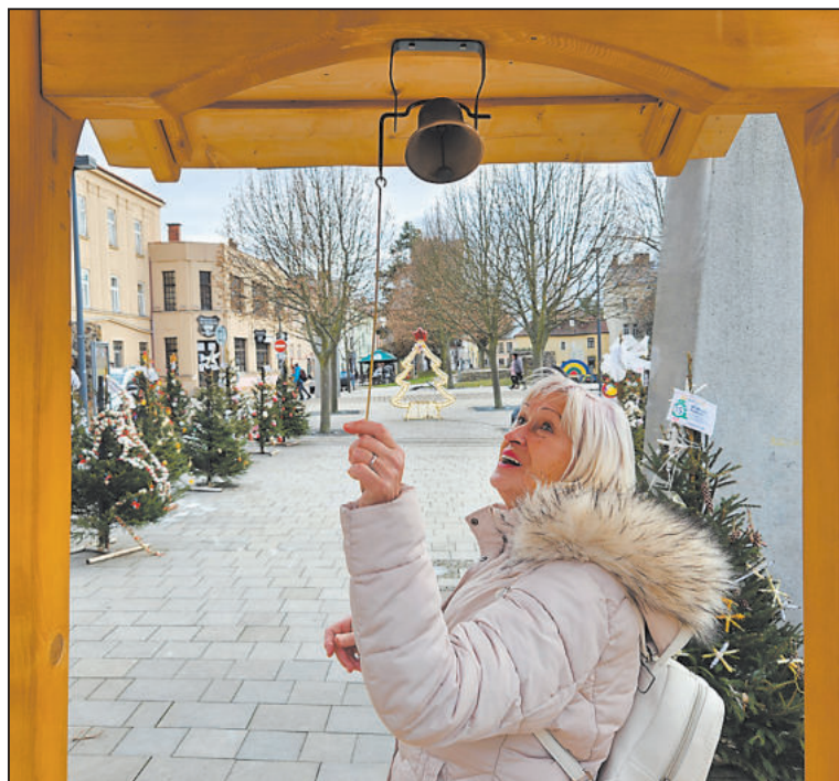
LETOS byly stromečky umístěny v parku Gustava Mahlera. Je zde i zvonice, na kterou si můžete zazvonit.