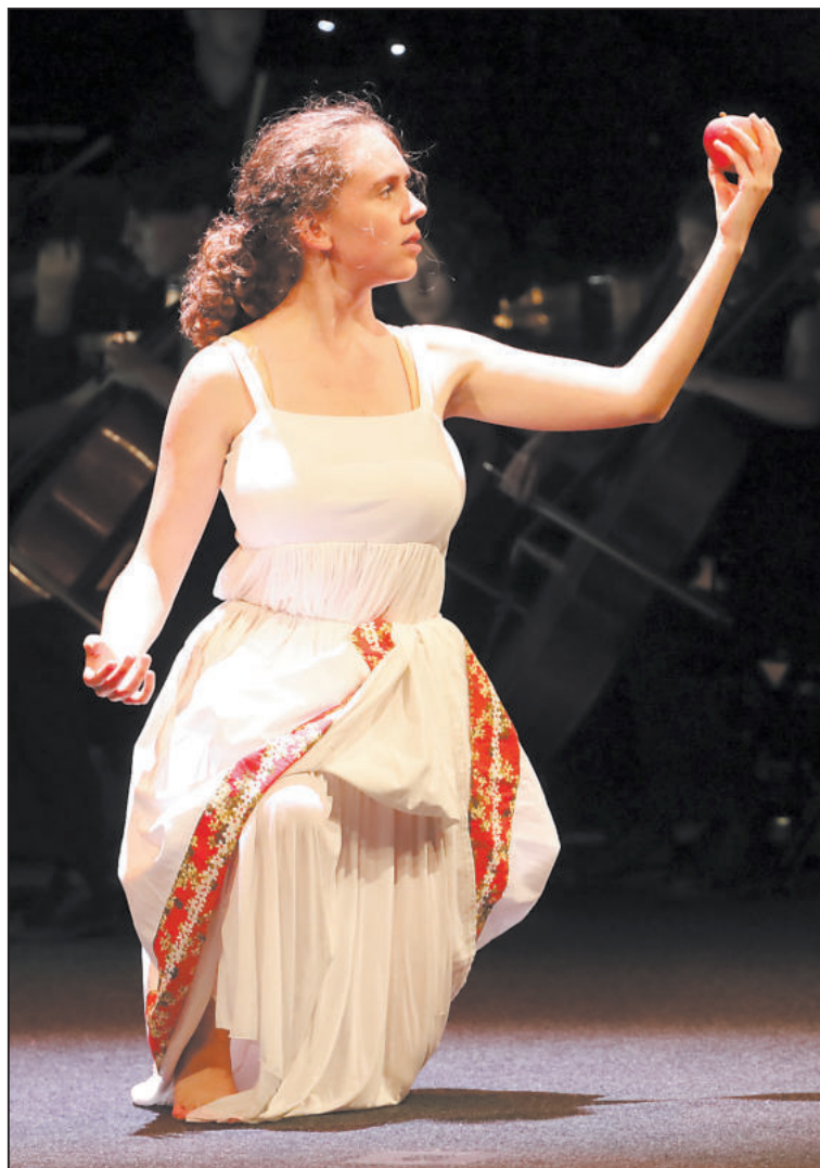
V ZACÁTKU koncertu vystoupili i žáci tanečního oboru ve skladbě Bohuslava Martinů – Koleda. Do toho jablka, které si všechny tančící dívky přinesly, se v úplném závěru zakously. Až to sborově chrouplo.

Na podiu padla i konkrétní čísla z projektu. V jeho rámci už bylo rozdáno 81 nástrojů v hodnotě 32 milionů. „Projekt měl přímý dopad na 8000 žáků hry na klavír, 620 pedagogů a 460.00 dalších žáků uměleckých škol.“