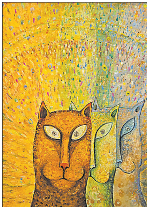
Kocouři září v září.