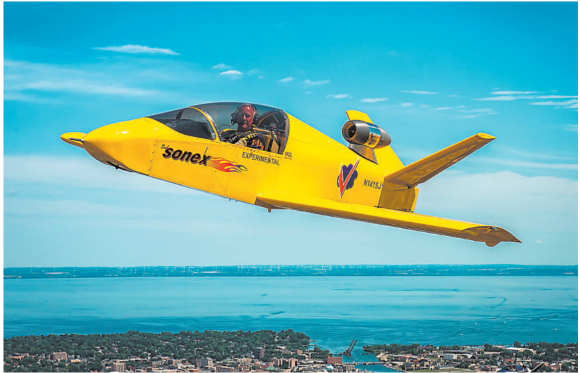
Americký letoun Sonex s proudovým motorem PBS TJ100.

Nabízíme širokou škálu proudových motorů v kategorii tahu od 400 do 2300 Newtonů. Pro lepší představu o velikosti a výkonnosti našich motorů uvedu konkrétní aplikaci. Náš dosud nejprodávanější motor PBS TJ100 s tahem 1250 N pohání mj. jednomístný proudový hobby letoun Sonex v USA. Zjednodušeně řečeno motor je schopen udržet ve vzduchu přibližně 125 kg, avšak skutečný výkon závisí na konstrukci