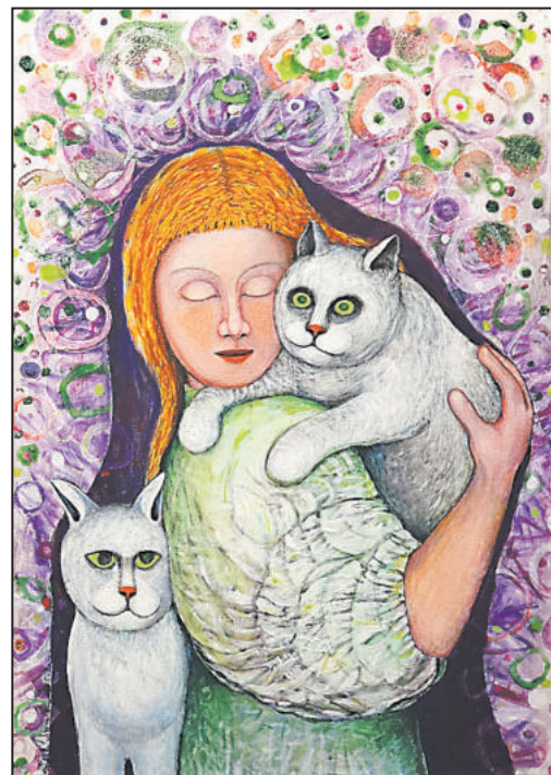
Tři kočky v županu.

Kočky a jiné bytosti je název výstavy pelhřimovské výtvarnice Evy Dolejšové (* 1957), která je k vidění v prostorách Kavárny Muzeum na Masarykově náměstí v Jihlavě. Tématem obrazů jsou její půvabně chlupaté přítelkyně kočky ve všech možných podobách. Výstavu lze zhlédnout do 18. února.