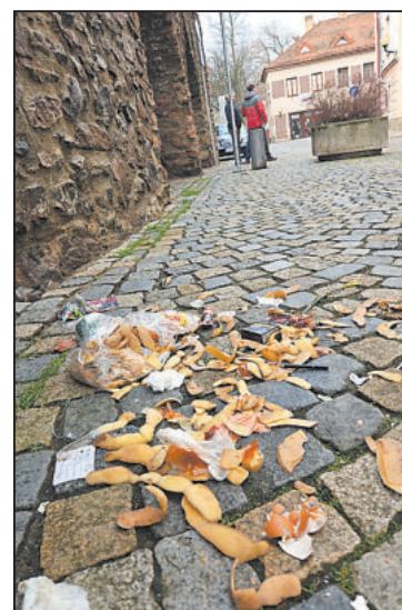
SNÍMEK z Věžní ulice u hradeb dává za pravdu primátorovi, který tvrdí, že se mnozí lidé neumí chovat. Odpadkový koš tu stojí asi o tři metry dál.

Dotazy od přítomných občanů zazněly i na bezpečnost (odpověď - je bezpečno, spíš někde není příjemně, což je nutné rozlišovat), revitalizaci