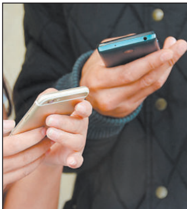
Ilustrační foto: pixabay.com

Objevují se také falešné weby, které vypadají jako ePortál České správy sociálního zabezpečení nebo Identity občana. Jediná správná doména ministerstva je mpsv.cz.