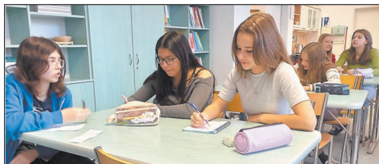
ŽÁCI a žákyně popisovali, co se jim v Jihlavě nelíbí.