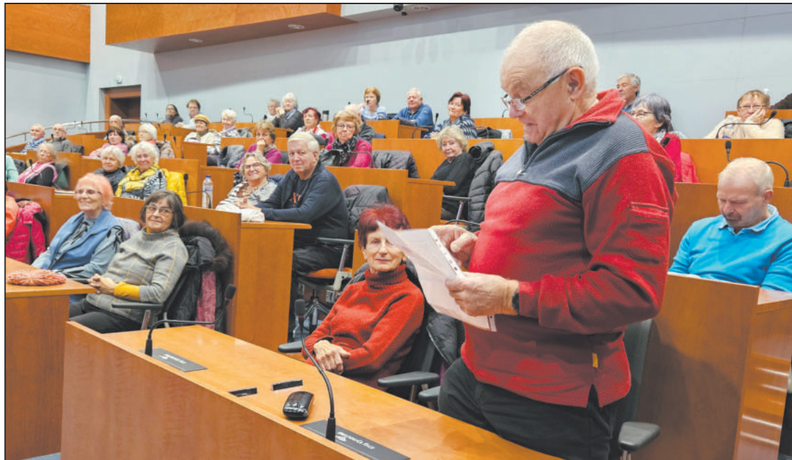
NA AKCÍCH spolku Nebojte se policie je vždy plno a také zábava. Třeba když jeden z přítomných napsal a přednesl svou vlastní báseň.