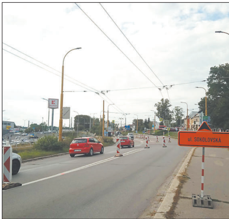
PRŮJEZD ulicí Romana Havelky je v době její rekonstrukce řízen semaforem.

Ulice Romana Havelky aktuálně prochází rozsáhlou rekonstrukcí a silnice zde získá nový povrch, který už byl opravdu potřeba. Doprava je zde řízena semaforem. Opravy silnice potrvají zhruba do poloviny října. -vd-