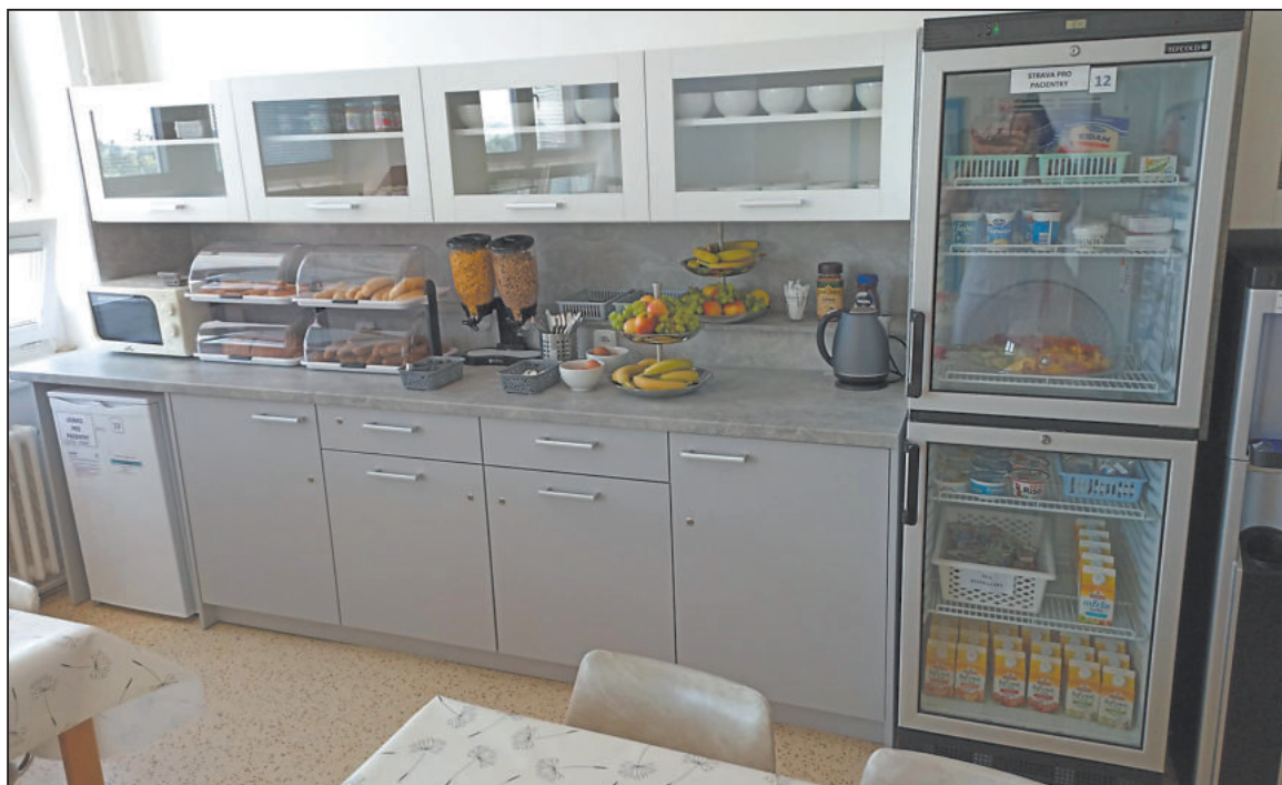
ŽENÁM na oddělení šestinedělí a rizikové gravidity je k dispozici snídaně občas po celý den.