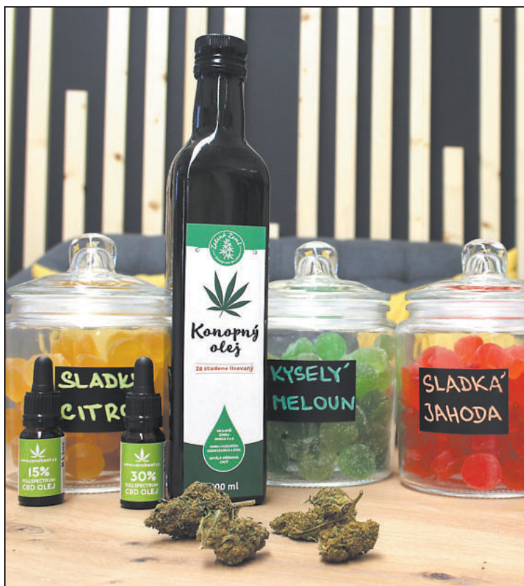
VÝROBKŮ s CBD je na trhu celá řada.

„Je ale důležité ještě zmínit, že ani CBD nelze užívat vždy a i při jeho užívání existují určitá omezení, kontraindikace a situace, kdy je lepší se před užíváním nejprve poradit s lékařem,“ shodují se manželé.