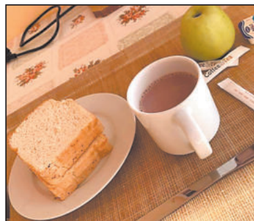
SNÍDANĚ nyní a snídaně před dvěma lety. To je opravdu velký rozdíl.