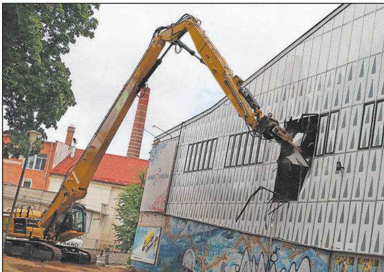
SYMBOLICKÉ zahájení demolic. Naplno začala 1. srpna.

Nyní jsou ale na pořadu bourací práce. „Jako první bude zbourána štítová hliníková prosklená stěna ze Smetanových sadů,“ vysvětlil JN Petr Kráčmar, stavbyvedoucí firmy Gemo,