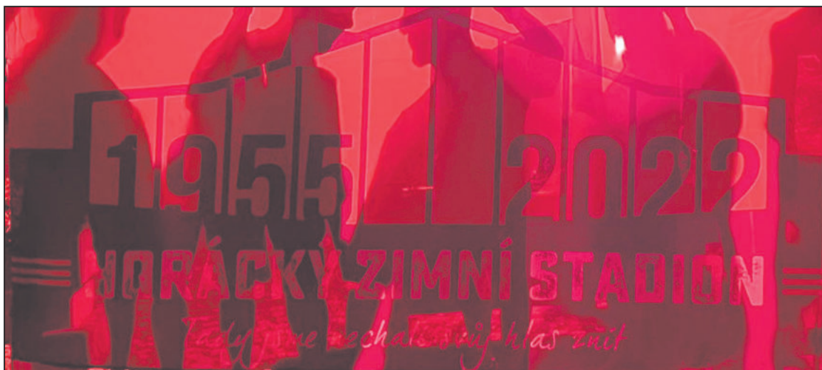
„TADY jsme nechali svůj hlas znít,“ hlásá nápis na vlajce fanoušků Dukly Jihlava, kteří se se zimním stadionem rozloučili po svém.

V polovině července se jednu páteční noc nad Horáckým zimním stadionem rozzářila obloha. Několikaminutovým ohňostrojem se zde s halou, která co nevidět „půjde k zemi“, rozloučili fanoušci hokejové Dukly Jihlava.