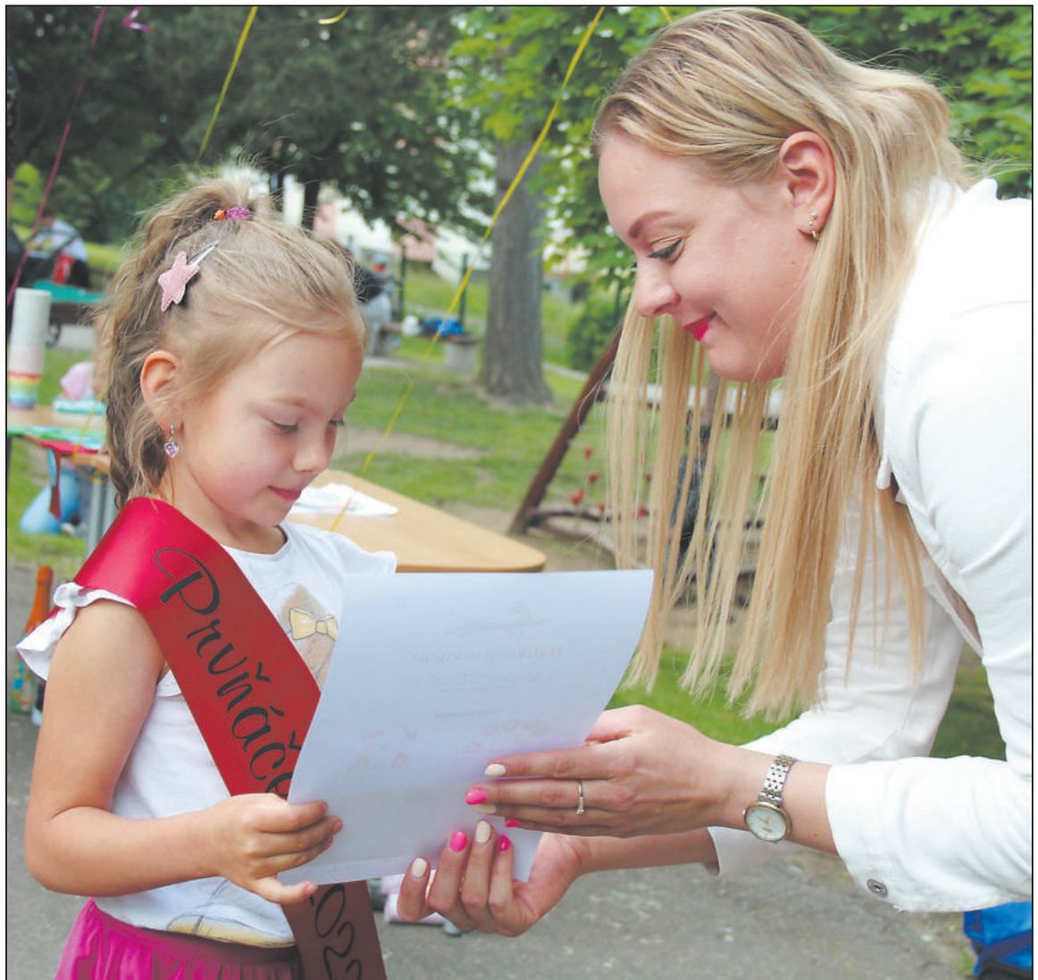
LOUČENÍ dětí a učitelek bylo plné emocí. Na památku si budoucí prvňáčci odnesli například šerpu nebo diplom.