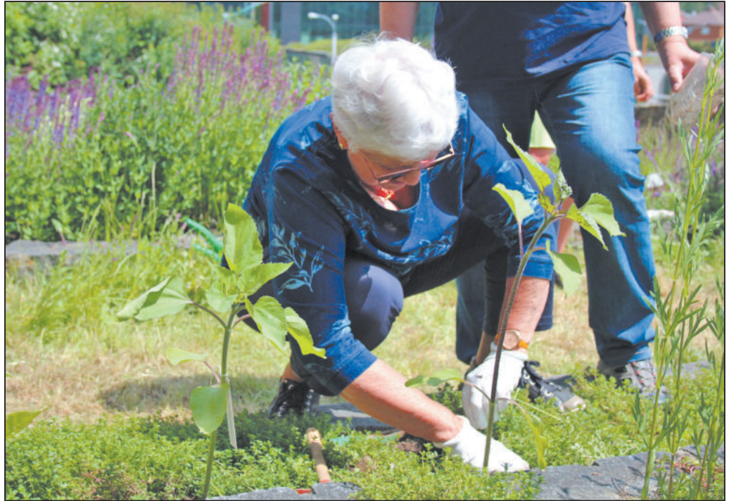
ZASADIT žlutou květinu dorazili i lidé, které nemoc nepostihla, ale přišli podpořit své blízké.

„Kdybych mohl, sázel bych taky. Nemoc mi však bohužel vzala rovnováhu, a tak nějaké dřepnutí či