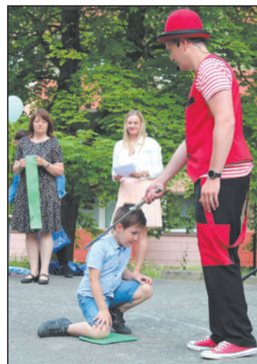
ASOVÁNÍ na prvňáčka je velká událost nejen pro děti, ale i rodiče.

Poté už přišla na řadu představení, která si pro všechny přihlížející připravily děti spolu s jejich učitel-