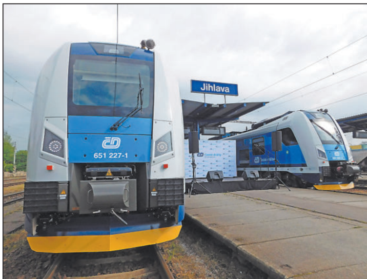
NANÁDRAŽÍ se představily nové vlaky.

Kupka také zmínil, že díky vyššímu komfortu v železniční dopravě si stále více lidí bude volit právě vlaky jako způ-