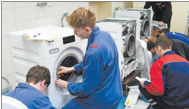
STUDENTI při soutěži.