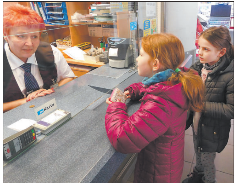
NĚKTERÉ děti si kupovaly jízdenku na vlak vůbec poprvé v životě, jiné byly už zkušené z výletů s rodiči.