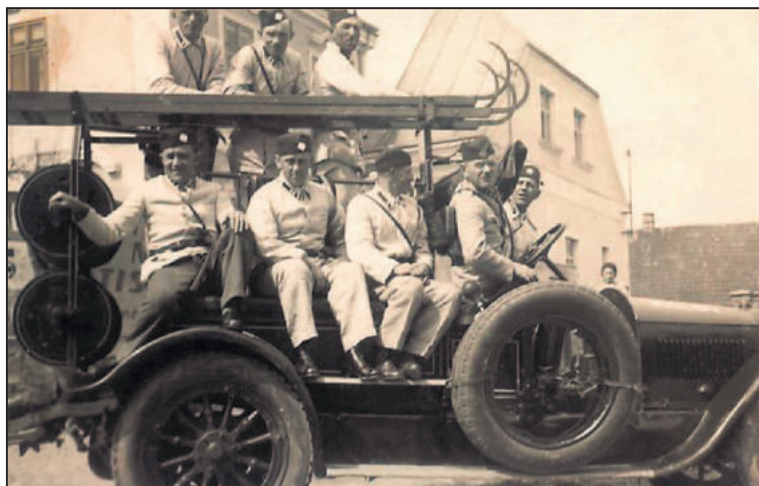
JIHLAVSKÁ Tatra 70A z roku 1934. Na svou dobu velmi výkonná automobilová stříkačka se čtyřmi výtláčnými hrdly, která ukazují na obrovskou sílu motoru. V roce 1954 byl vůz převeden do Luk nad Jihlavou. V roce 1972 putoval do Kopřivnice.