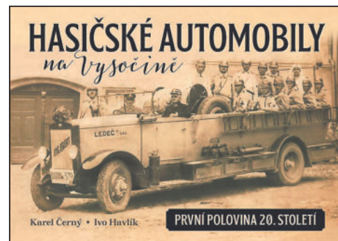
KNIHA vyšla na podzim loňského roku v nakladatelství Tváře.

V knize je hned několik automobilů z Jihlavy, které zde v minulosti jezdily.