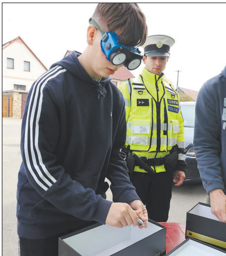
MEZI dovednostní disciplíny patřilo i roztřídění a smontování různě velkých matic a šroubů, samozřejmě poslepu.