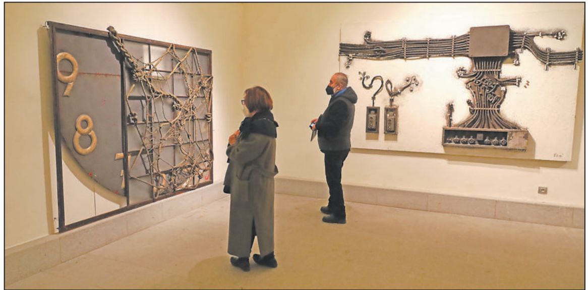
NĚKOLIKAMETROVÝ objekt složený z ciferníku, rámu, průmyslového okna a spletených lan váží kolem jednoho sta kilogramů. Velká díla Petra Vlacha vyniknou právě v nádherném výstavním sále bývalé zámecké konírny třebíčského zámku. Děníera výstavy se koná až 27. března

Loňská oprava střechy radnice a radničních hodin ukázala, že pod obrovitým ciferníkem se nalézá ten původní. Město rozhodlo, že se vydá cestou historie a na hodinách renovuje ciferník starý. Co ale s tím novým, který pobýval na věžičce radnice „jen“ několik desítek let?