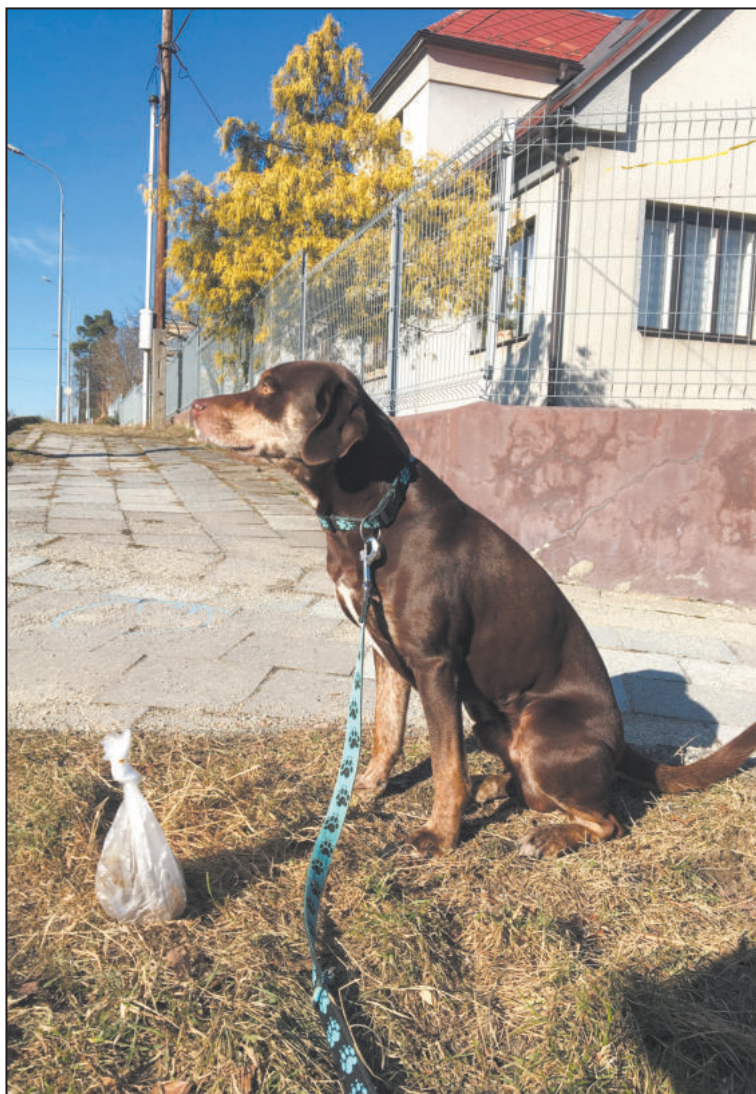
MAJITELÉ psů mají v některých částech města problém. Chybí tam koše na odpadky.

„To mám házet bobek do popelnice rodinných domů? Otevřít vrátka a jít k nim na zahradu, když mají popelnice schované?“ říká jedna z pejskařek, venčící v lokalitě ulic Dělnická, Družstevní a Helenínská, a dodává, že sázkou na jistotu jsou popelnice Dětského domova se školou v Dělnické ulici pod