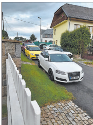
JEDNOSMĚRNÁ ulice Škroupova nemá chodníky.

A pokračuje: „Zatím zde došlo pouze ke sražení psa na vodítku. Přitom řešení je podle nás obyvatel uvedené ulice tak prosté a jednoduché. Změnit režim jednosměrných ulic Škroupova a U Slunce. V ulici U Slunce jsou dva vyvýšené chodníky a pouze dva výjezdy vozidel od rodinných domů. V ulici Škroupova je výjezdů z garáží a od