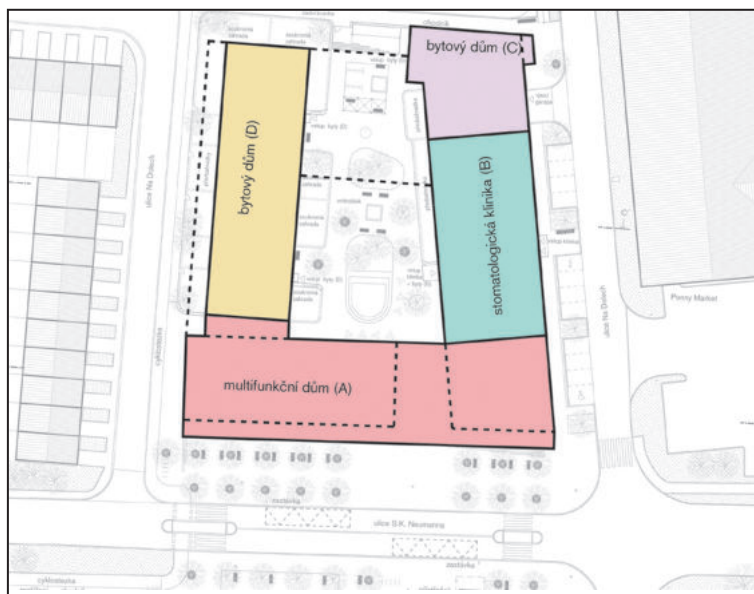
ÚZEMNÍ STUDIE - lokální centrum Dolina. Blok za Penny Marketem je rozdělen do čtyř hlavních stavebních objektů na společných dvou podzemních podlažích garáží.

Po první větách jsem se pomalu radoval, že město vybere zájem-