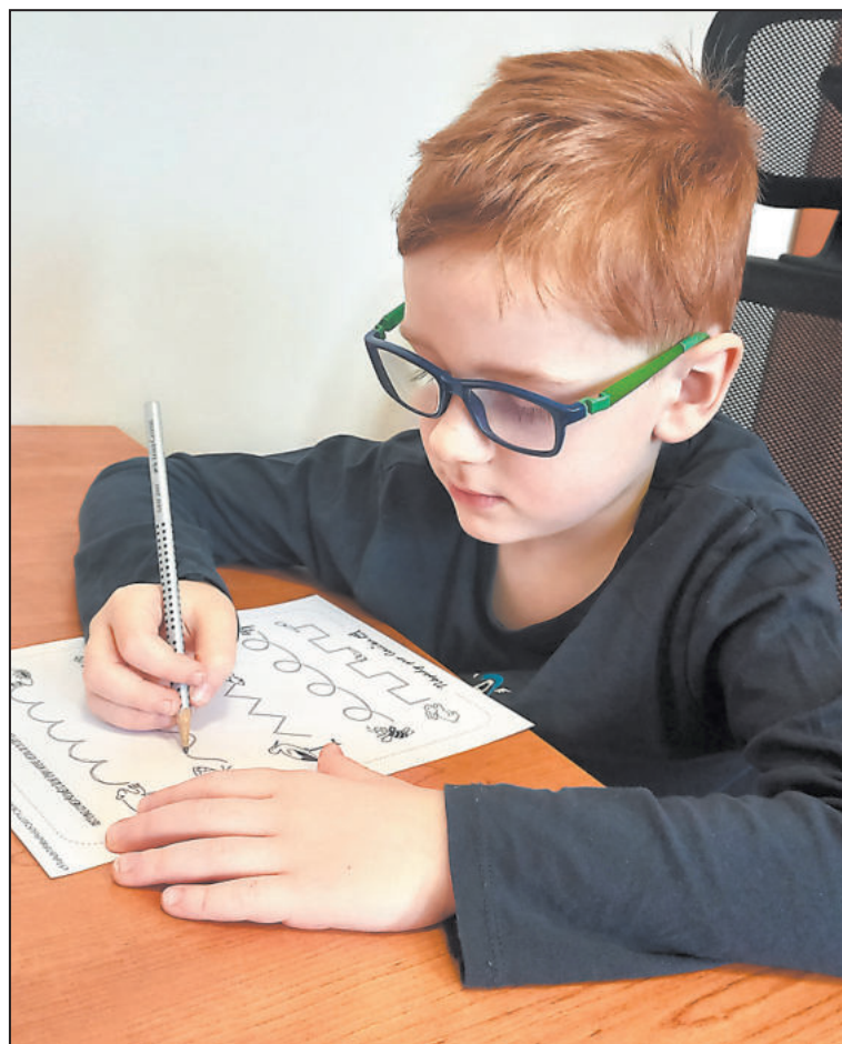
PŘÍPRAVA na školu se může uskutečňovat zábavnou hrou.

V současné době tento svátek nijak neslavím, ale jsem moc ráda, že žiju v naší době a v naší kultuře, kde jsou ženy po boku mužů. Byť stále ve společnosti existuje nějaká míra předsudků a diskriminace.