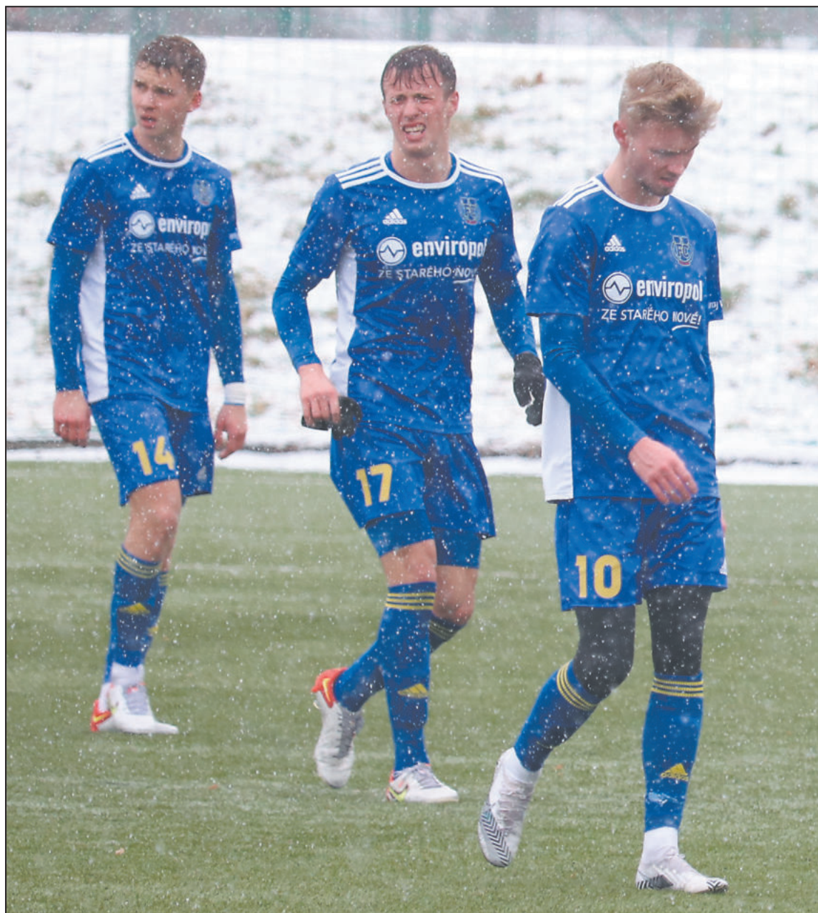
CHLADNOU ZIMU na Vysočině fotbalisté Jihlavy na chvíli vyměnili za příjemné počasí v chorvatské Poreči.