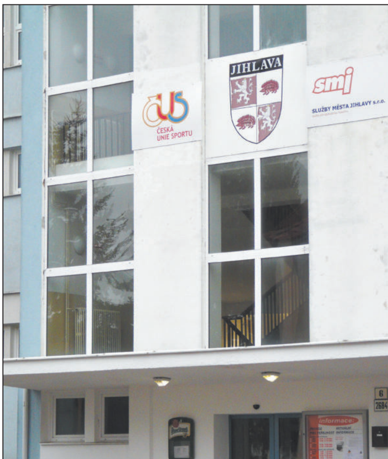
BAZÉN Evžena Rošického začali stavět před více než 60 lety. Na jeho vnější fasádě je znak města ještě ve starém provedení.

tek jihlavské primátorky Petr Ryška (ODS). „Na bazénu v Rošického ulici je znak města. Takže tam ta propagace města je, ale asi se to dá nějakým způsobem ještě zvýraznit,“ reagoval na podnět radního.