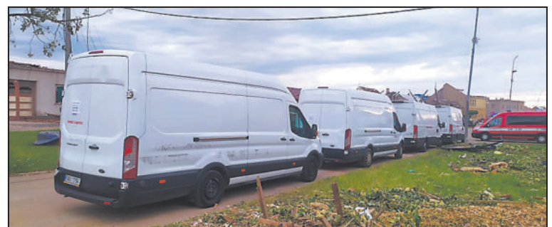
PŮVODNĚ měla vyjet na jih Moravy jen jedna dodávka. Ve finále vyrazila čtyři plná auta.

Chtěla jsem pomoci už od začátku a chtěla jsem pomoci konkrétní osobě, konkrétní rodině.