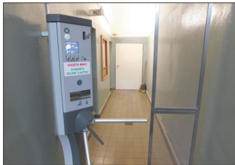
JEDNO se jihlavským veřejným záchodkům upřít nemůže – jsou udržovány v čistotě a stojí pouze 5 Kč.