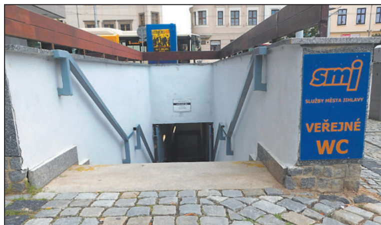
VEŘEJNÉ toalety se nachází vedle restaurace McDonald's v Prioru... pod zemí.

Navíc pro zákazníky, kteří si přišli v klidu posedět na kávu či oběd, by asi taky nebylo příjemné, kdyby zde neustále proudily zástupy lidí a čeka-