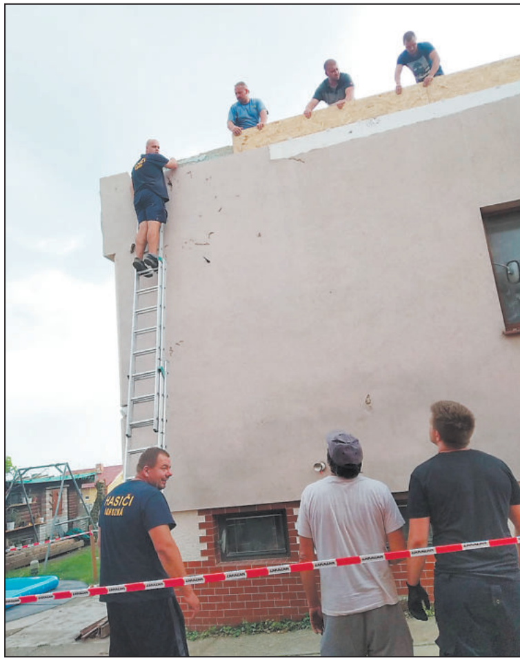
ŠIKOVNÉ ruce byly v postižených oblastech velmi potřebné.

V autě jsme měli nakoupený potřebný materiál, místní ženy nám s sebou napekly něco sladkého a na nás už bylo to tam vše odvézt, předat a pomoci, kde bylo třeba. Jeden z kamarádů, co se mnou jel, je zkušený zedník a jeho pomoc byla v místě velmi potřebná. Zbytek naší party mu tedy byl k ruce. I proto bychom chtěli do postižené oblasti v nejbližší době ještě alespoň jednou vyrazit.