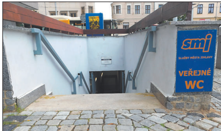
VEŘEJNÉ toalety se nachází vedle restaurace McDonald's v Prioru... pod zemí.

Navíc pro zákazníky, kteří si přišli v klidu posedět na kávu či oběd, by asi taky nebylo příjemné, kdyby zde neustále proudily zástupy lidí a čeka-