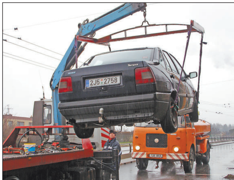
PRO ODTAŽENÁ vozidla bude vyčleněn prostor v areálu Dopravního podniku.

Na ruční čištění najaly SMJ třicet brigádníků, kteří budou zajišťovat škrábá-