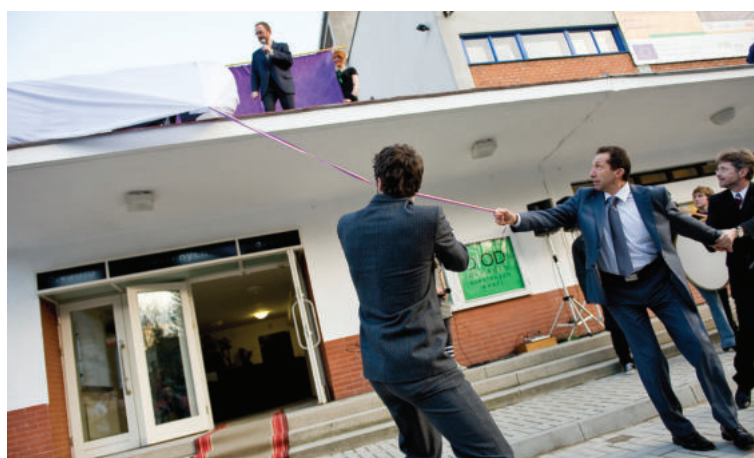
1. 4. 2011 otvíráme DIOD

akrobatickou zkušebnou, dostala Jihlava prostor, kde mohou tvořit a prezentovat se všechny generace ve všech možných žánrech. K tomu produkční zázemí, nezávislost, protože DIOD provozuje ve své budově TJ Sokol Jihlava a po těch deseti letech i aktivní publikum. Každé město má mít své kamenné divadlo nebo kino, ale pokud chce,