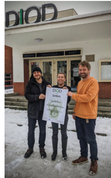
Současný tým DIODu

žánrový, variabilní sál je dnes přesně to, co především nastupující generace tvůrců potřebuje. Díky tomu, že DIOD je zároveň divadlem, kinem, hudební scénou nebo galerií a třeba