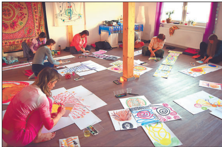
ARTETERAPIE může pomoci člověku poznat sám sebe.

všechno je možné z obrázků vyčíst. „Není to jen o diagnostice, ale i o tom prožitku, který během toho, co tvoříte, máte. Během malby vám mohou vylézt na povrch různé informace o vás,“ vysvětluje Lucie.