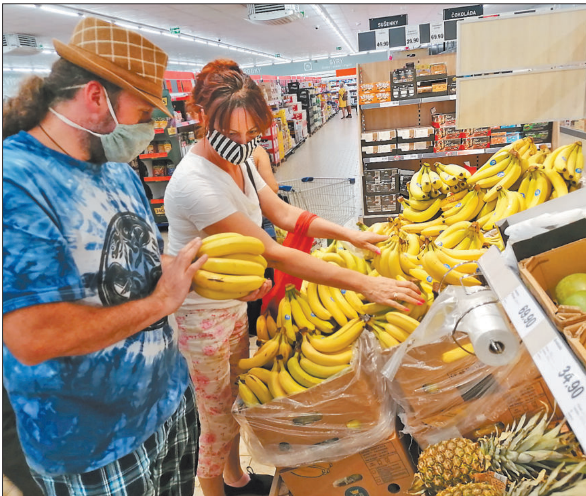
ROUŠKY. Od září se opět staly součástí našich životů ve vnitřních prostorách roušky. Na jak dlouho tu s námi budou, těžko říct. Poslední odhady ministerstva zdravotnictví říkají, že až do března 2021.