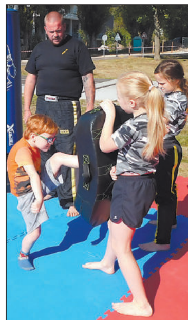
DĚTI, které už nebavila jízda na kolech si mohly vyzkoušet například kickbox.