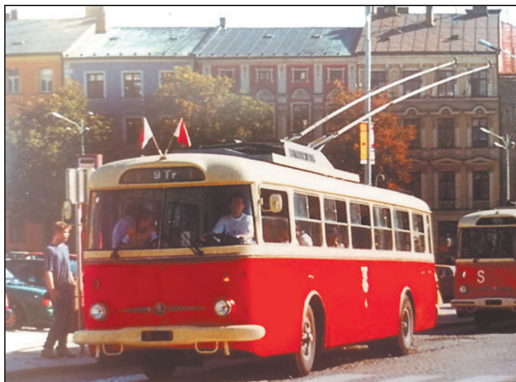
Trolejbus TR9, kterému se říkalo Beruška.

mínce, „vzbudil nás většinou až nějaký cestující, který nám zabušil na okno s dotazem, jestli už bychom náhodou nechtěli vyjet.“