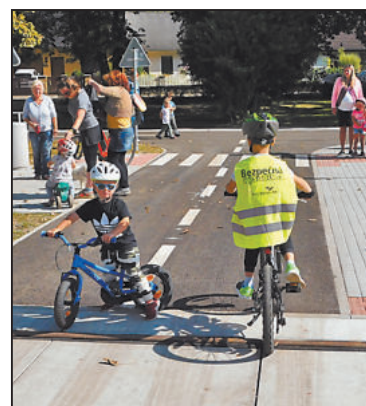
NA SILNICE se vydali i ti nejmenší, kteří dopravní značení ještě neovládají a bylo tak potřeba být navzájem opatrní.