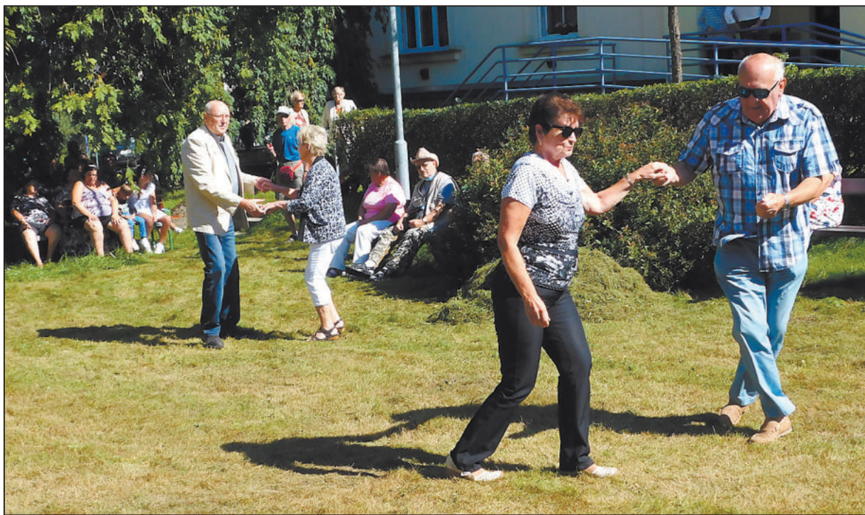
SENIORŮ si v parčíku na ulici K. Světlé užili poslechu příjemné hudby. Pohodové odpoledne jim zajistila kapela Triomix.

„Tyto akce pořádám 17 let a každý rok vyjde počasí. Některé roky bylo opravdu až neúnosné vedro, ale přesně v čas začátku akce se zatáhlo a bylo nakonec příjemně nebo třeba přišlo a opět v čas konání pršet přestalo,“ popisuje