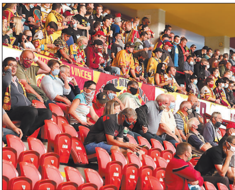
PŘÍZNIVCE hokejové Dukly zatím domácí utkání kvůli hygienickým opatřením a leklé atmosféře až tolik nebaví.

Za těchto podmínek lidem sport až tolik nechutná. Dukla to v úvodních dvou domácích zápasech pocítila na návštěvnosti. Ačkoli má povolenou kapacitu 2.000 diváků, dorazilo jich na Prostějov a Ústí nad Labem 714, respektive 554. Permanentky nešly na odbyt tak dobře jako v minulých letech.