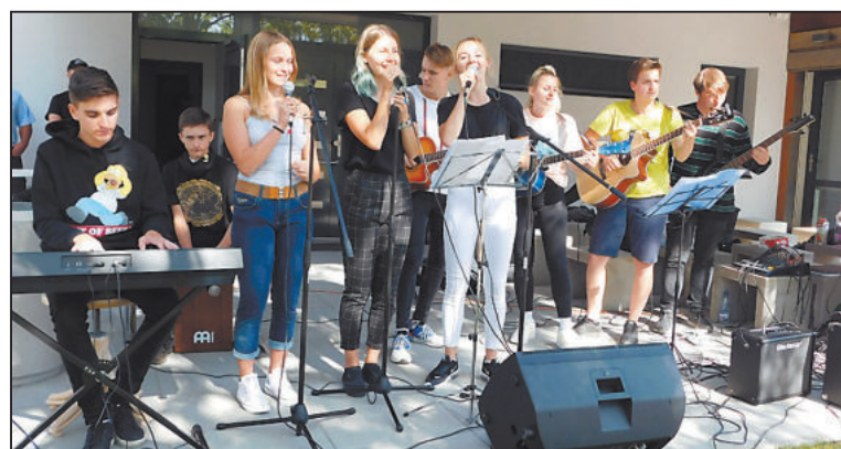
O HUDEBNÍ doprovod se postaral dětská hudební kapela.