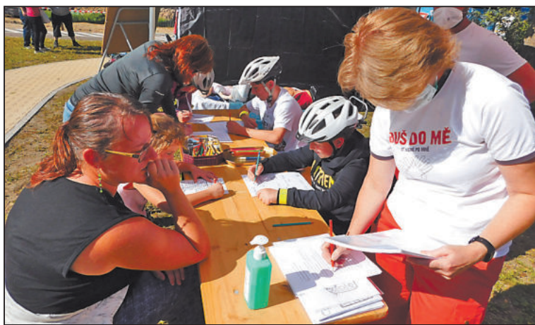
NA STANOVIŠTÍCH si návštěvníci vyzkoušeli své znalosti.