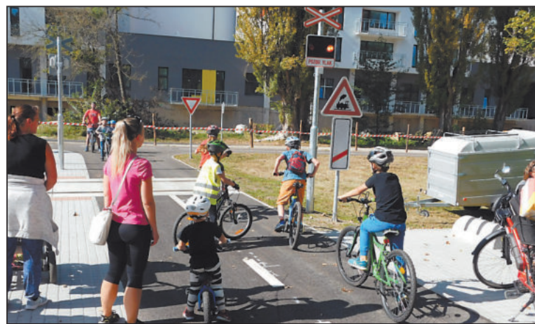
ŽELEZNIČNÍ přejezd i s funkční světelnou signalizací.