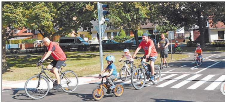
NA KŘÍŽOVATKÁCH je potřeba dávat pozor i na dopravním hřišti.

Do konce října by kolem dopravního hřiště měla být dokončena také cyklostezka.