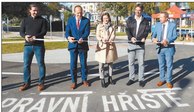
SLAVNOSTNÍ přestřižení pásky na zrekonstruovaném dopravním hřišti.

Kolem 15. hodiny už bylo hřiště opravdu plné a většina dětí dodržovala dopravní předpisy. Menší účastníci provozu, kteří ještě nejsou takto vzděláni, naháněli většinou jejich rodiče, aby nedošlo k nějaké drobné dopravní nehodě.