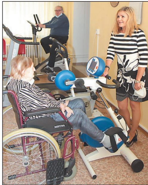
KLIENTI Domova pro seniory na Lesnově mají k dispozici posilovnu pro udržení zdraví.

Domov má dvě moderně zařízené centrální koupelny. Klienti mají u lůžka signalizační zařízení, které slouží pro přivolání obsluhy. Zdravotnický personál je vybaven přenosnými pagery, což zkvalifikovalo práci v tom smyslu, že nyní může reagovat na přivolání i v případě, že se nenachází v dosahu signalizačního zařízení.