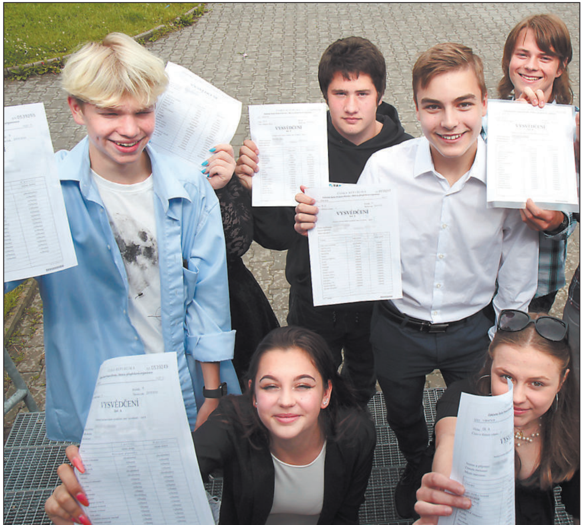
ŠKOLNÍ ROK SKONČIL. Pro devátáky ze ZŠ Demlova je vysvědčení rozlučkou se základní školou, mnozí pokračují na středních školách. Letošní rok poznamenalo uzavření škol kvůli epidemii koronaviru, ale doufejme, že výpadek ve výuce studenti brzy doženu.