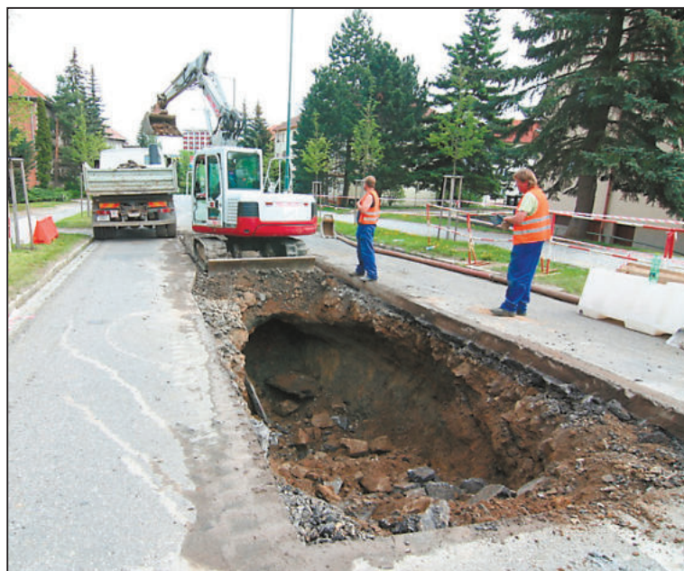
V HAMERNÍKOVĚ ulici v Jihlavě vznikla jáma. Propadala se tu vozovka.