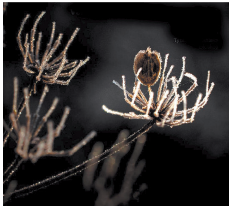
FOTOGRAFIE NA LÁTCE. V kavárně DIODu (Bioskop) v Tyršově ulici 12 vystavuje členka Horáckého fotoklubu Mirka Patočková čtrnáct velkoformátových fotografií, vytištěných na látkový podklad. Výstava je prodejní a potrvá do konce února.