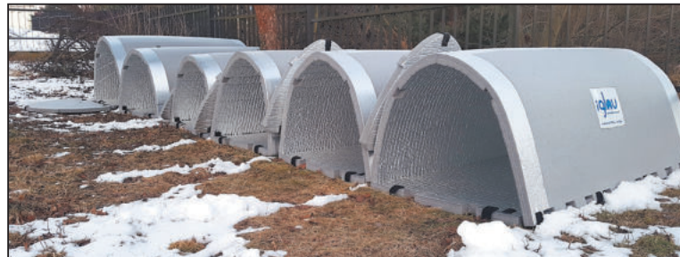
JEDNO iglů pro dva a pět pro jednoho je k dispozici bezdomovcům v lokalitě Havaj.