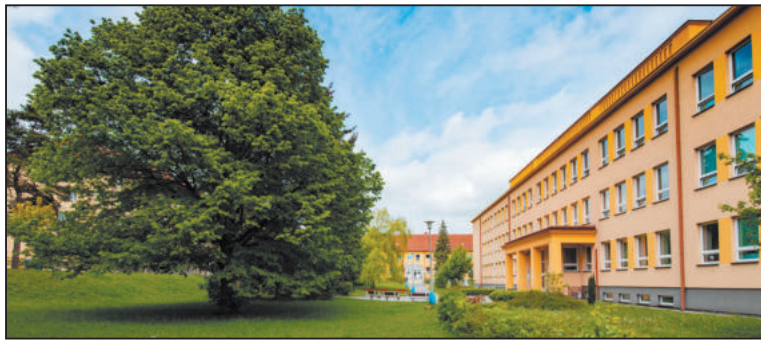
ÚPRAVA okolí základní školy E. Rošického je jednou z priorit v rámci rozvojové úpravy programu Město přátelské k dětem.

V České republice stráví 27 procent všech dětí více než dvě hodiny u počítače denně. Nadváhou trpí 15 procent dívek a 25 procent chlapců, 80 procent dětí nemá dostatek přírodního pohybu.