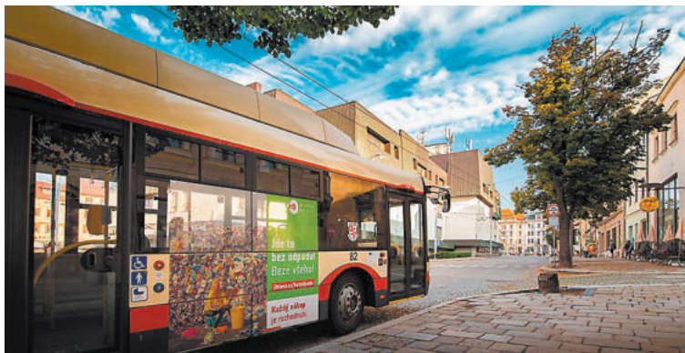
NOVÝ typ trolejbusu Škoda 32 Tr, který koupí DPMJ, bude vystaven 22. září při Dnu otevřených dveří.

„Návštěvníci si budou moci trolejbus Škoda 32 Tr detailně prozkoumat i zevnitř, chybět ale nebude ani občerstvení a musím zmínit, že akce se bude konat za každého počasí, protože veškerá zábava bude ve vnitřních prostorách samotného podniku,“ pozval Radim Rovner. -tz-