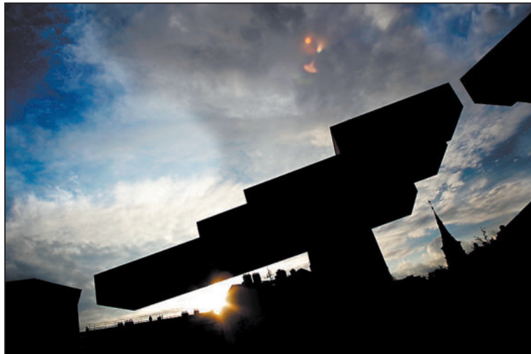
Mistr zve Tebe Autor: Aleš Hrdlička.

Do nového ročníku už nám přišlo pár parádních fotografií, například: