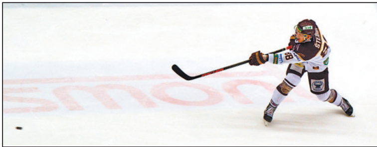
PROFESIONÁLNÍ hokejisté se budou muset při odstávce na zápasy přesunout do exilu. Zatím to vypadá na Havlíčkův Brod nebo Pelhřimov.

Hokejový klub HC Dukla Jihlava bude muset přesunout zápasy A-tý-