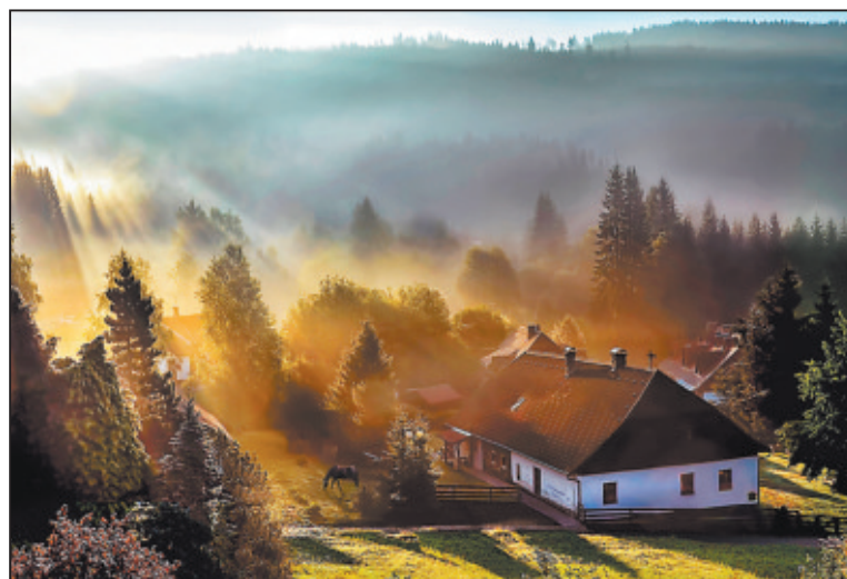
ROMANTICKOU fotografii vytvořil dlouholetý člen fotoklubu Leoš Tůma.

Již v roce 2001 HFJ vítězí v mapovém okruhu „Vysočina“, a