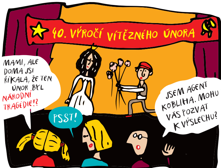
V ROCE 1988 SE VŠUDE SLAVILO 40. VÝROČÍ VÍTĚZNÉHO ÚNORA 1948. AMATÉRSKÉ DIVADLO V JIHLAVĚ SLAVILO POHÁDKAMI – SNAD PROTO, ŽE V NICH PRAVDA A LÁSKA VĚDY ZVÍTĚZÍ NAD LŽÍ A NENÁVISTÍ.