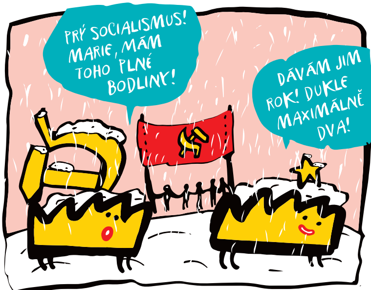
VÍTĚZNÝ ÚNOR – NEBO TAKY ÚNOROVÝ PUČ BYL PŘECHODEM OD DEMOKRACIE K TOTALITĚ, PŘIPOJENÍM K SOVĚTSKÉMU BLOKU, POČÁTKEM ÚTLAKU OBYVATEL A PŘÍČINOU EKONOMICKÉHO ÚPADKU A OBROVSKÉ EMIGRAČNÍ VLNY. DUKLA ZÍSKALA PRVENSTVÍ V ROCE 1990...