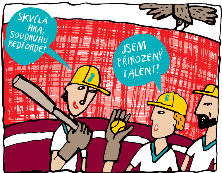
ZAČÍNÁJÍ K NÁM PRONIKAT NOVÉ SPORTOVNÍ DISCIPLÍNY. V JIHLAVĚ VZNIKL PRVNÍ SOFTBALOVÝ KLUB EKONOM JIHLAVA. POZDĚJI SE UCHÝLIL POD KŘÍDLA (NA HRŠTĚ) SOKOLA.