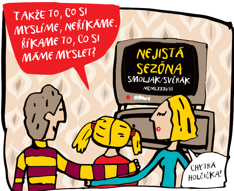
VZNIKL OBLÍBENÝ FILM NEJISTÁ SEZÓNA ZE ŽIVOTA DIVADLA JÁRY CIMRMANA.