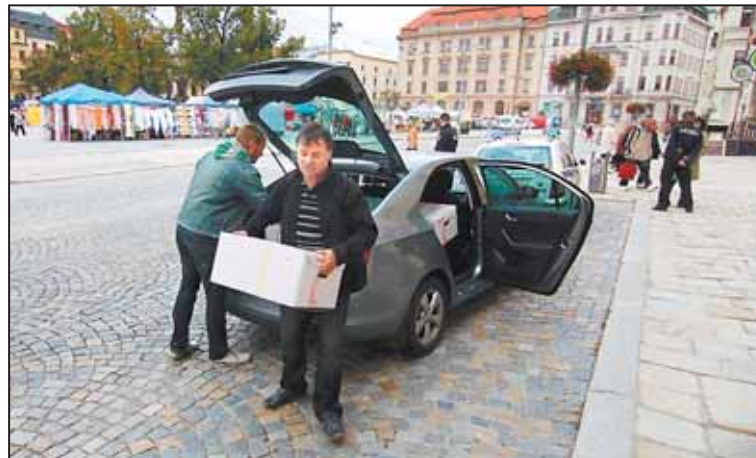
ZÁSTUPCI SVAK přivezli na magistrát majetkovou a provozní evidenci majetku s právem hospodaření.

Na webové stránce města www.jihlava.cz v sekci Vystoupení Jihlavy ze SVAK Jihlavsko jsou transparentně umístěny dokumenty a komunikace spojené s odchodem města ze svazku a návratem majetku města. -rt-