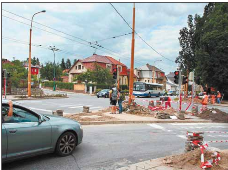
KŘIŽOVATKA u autobusového nádraží by měla splňovat všechny nároky na moderně řízenou křižovatku.

Ve výběrovém řízení na úpravu křižovatky nabídla nejnižší cenu brněnská firma PATRIOT s.r.o. - 3,8 milionu korun. Harmonogram je připraven do konce srpna, pokud práci nezkomplikuje počasí nebo nějaké jiné problémy, firma zakázku předá co nejdříve. -Im-