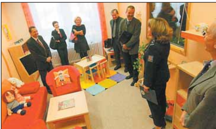
JAKO DĚTSKÝ pokoj vypadá nová výslechová místnost pro děti na Policii ČR.

V minulém roce jihlavská policie vyslechla více než sto dětí, které se dostaly do kontaktu s kriminálními činy. V České republice je momentálně 34 moderních výslechových místnos-