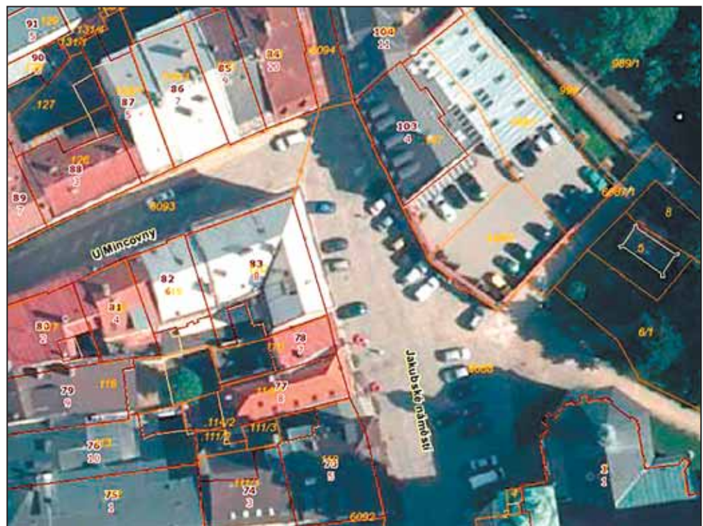
AREÁL bývalé Vojenské správy.