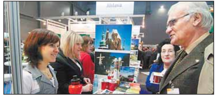
NEJVĚTŠÍ zájem měli návštěvníci stánku města Jihlavy na veletrhu cestovního ruchu o informace o cyklotrasách Stříbrného Pomezí.