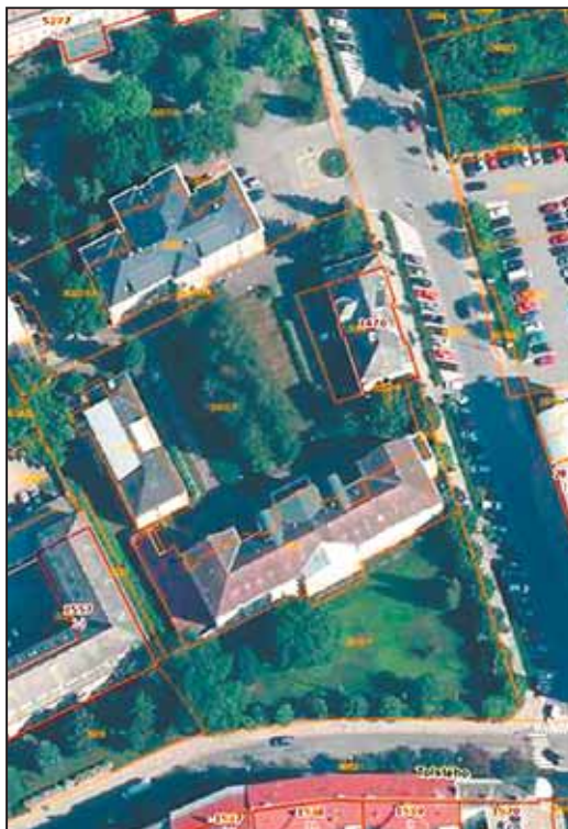
AREÁL bývalé urologie Staré nemocnice.