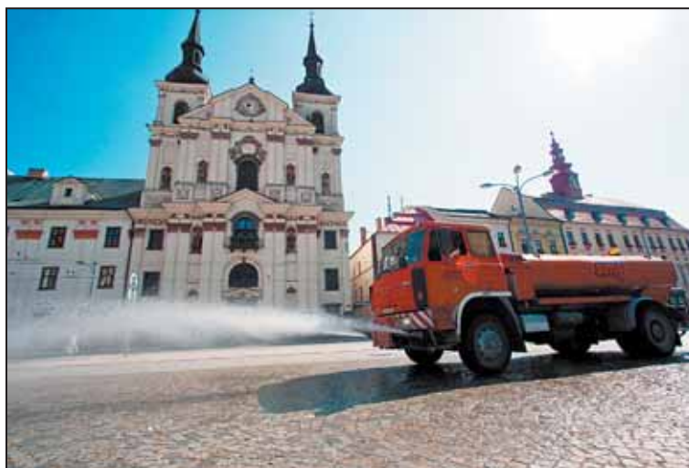
ROZPÁLENOU DLAŽBU v centru města v horkých letních dnech ochlazovala voda z kropičního vozu.

375.457,- Kč Autorský dozor: 42.000,- Kč Inženýrská činnost: 156.000,- Kč Stavební práce: 2.969.545,20 Kč Měření hluku: 19.926,- Kč (-Im, tz-)