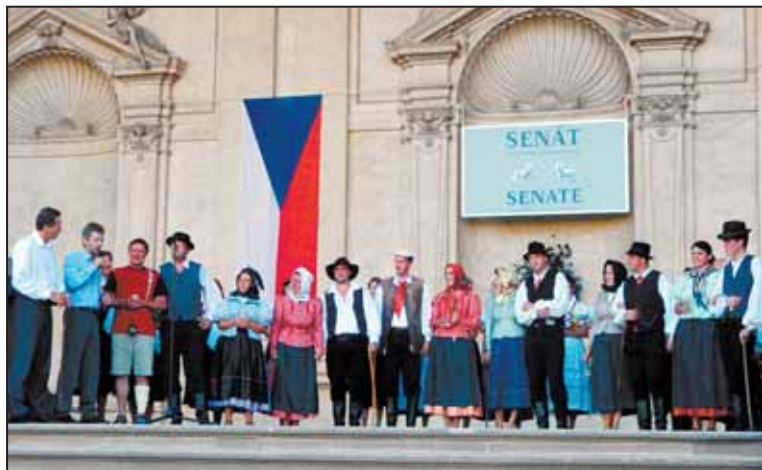
VYSOČAN se představil v programu Kulturního léta Senátu ve Valdštejnské zahradě.