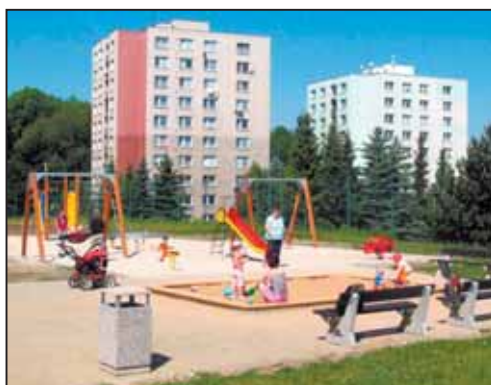
MĚSTO v posledních pěti letech investovalo čtyři miliony do dětských hřišť.

Dalších pět dětských hřišť získalo město od developerských společností při budování nových sídlišť. „Další dětská hřiště budujeme v jiných ucelených projektech, jako jsou revitalizace sídlišť, sportovní a volnočasové areály a podobně,“ doplnil primátor Vymazal.