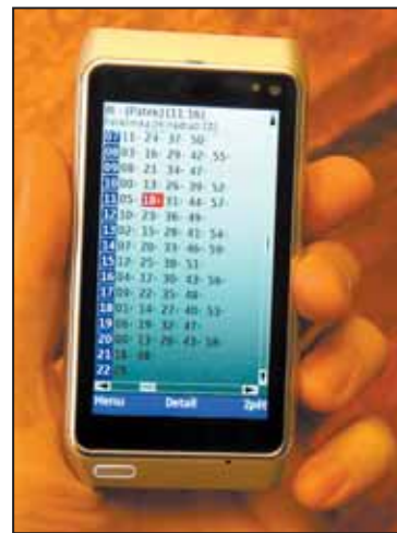
KDEKOLI i bez signálu si můžete vyvolat v telefonu odjezdy MHD, které vás zajímají.

Jízdní řády si můžete do telefonu stáhnout prostřednictvím počítače