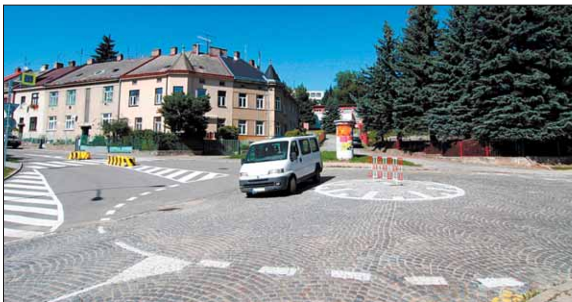
DALŠÍ kruhový objezd vznikl za minimální náklady v křižení silnic Telečská, Svatopluka Čecha, U Dvora a Pod Příkopem.

Střed křižovatky je řešen zvýšeným vydlážděným retardérem, který ale nevadí případnému průjezdu dlouhých nákladních vozidel.