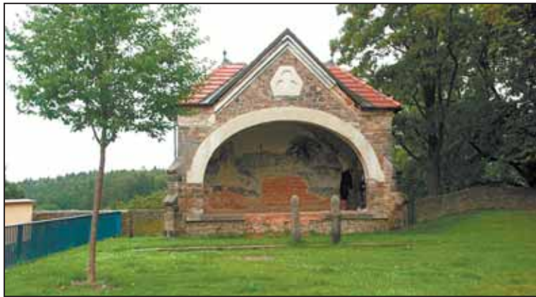
KAPLE se sochami vedle vchodu do lesoparku Heulos v sousedství kostela sv. Jakuba projde rekonstrukcí.

Jihlavská radnice hodlá upravit část historického centra. Úpravy se budou týkat části historického opevnění za kostelem sv. Jakuba, ale také Masarykova náměstí a lesoparku Heulos. Návrhy zpracované ve studii regenerace městské památkové rezervace si prohlédli radní a dali zelenou další přípravě.