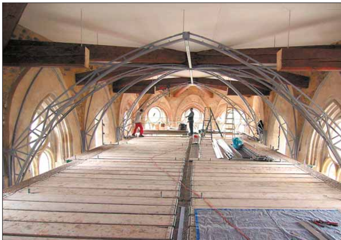
ODBORNÁ firma obnovuje v kostele Povýšení sv. Kříže klenby v presbytáři z pnuté fólie v rozsahu původní klenby.

16. – 22. září. (Programovou nabídku přinášíme uvnitř vydání NJR).