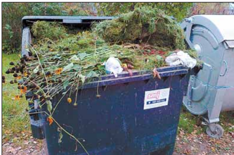
ZAHRÁDKÁŘI na ulici U Hřbitova naházeli kompost do popelnice SMJ.