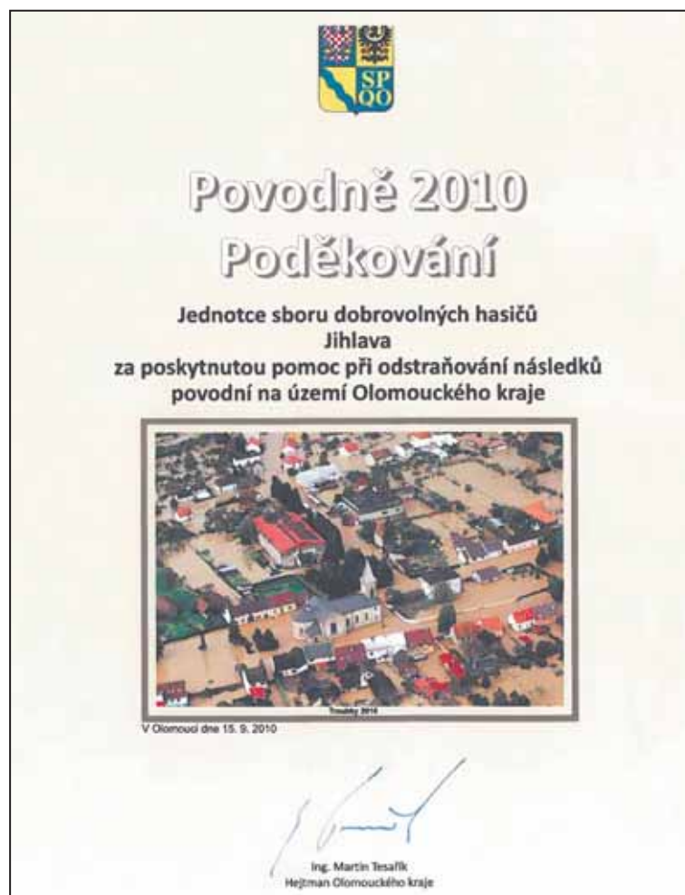
HEJTMAN OLOMOUCKÉHO kraje poděkoval jihlavským hasičům za pomoc při povodních.

Odpad z údržby zahrad, jako je posekaná tráva, větve, listí atd., může každý kompostovat na svém pozemku a vzniklý kompost následně využít. Další možností je tento odpad odvést do kompostárny v areálu skládky Henčov, kde je pro občany města Jihlavy možnost odložit biologicky rozložitelný odpad zdarma . Na podporu domácího kompostování poskytuje město dřevěné kompostéry za zvýhodněnou cenu 150,- Kč. O kompostér si lze zažádat na odboru životního prostředí Magistrátu města Jihlavy. -Im-