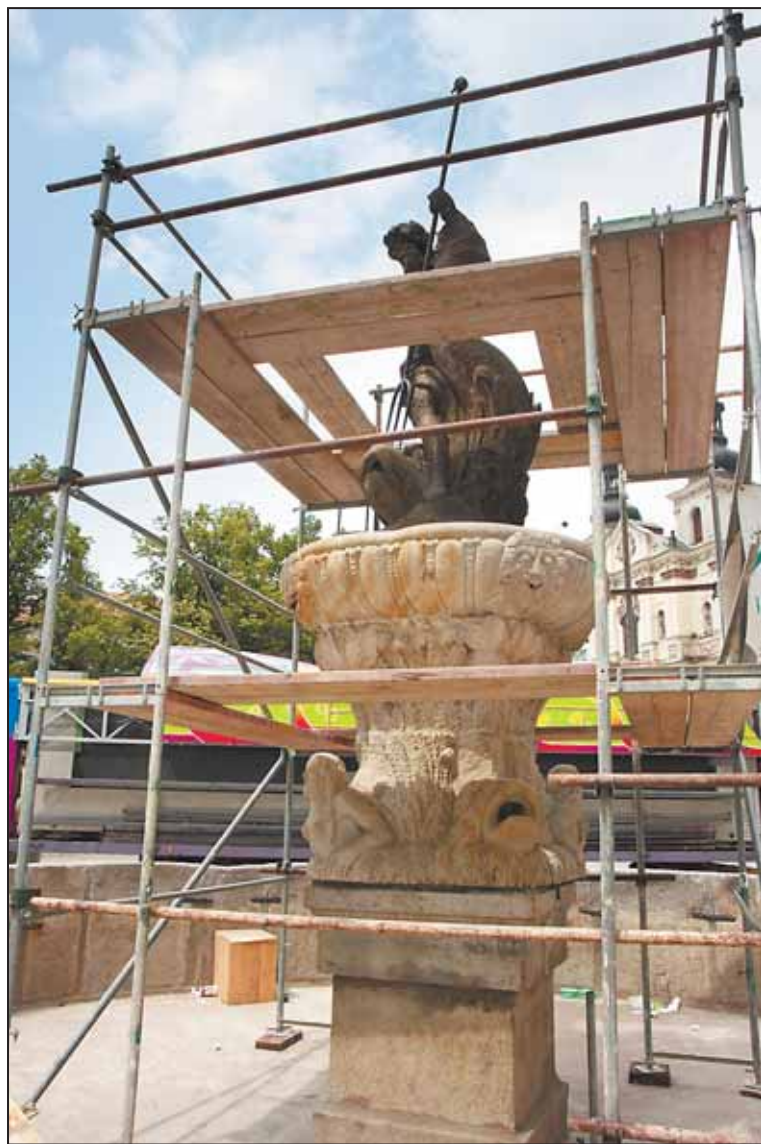
OBĚ KAŠNY a morový sloup prochází nebo projdou rekonstrukcí.