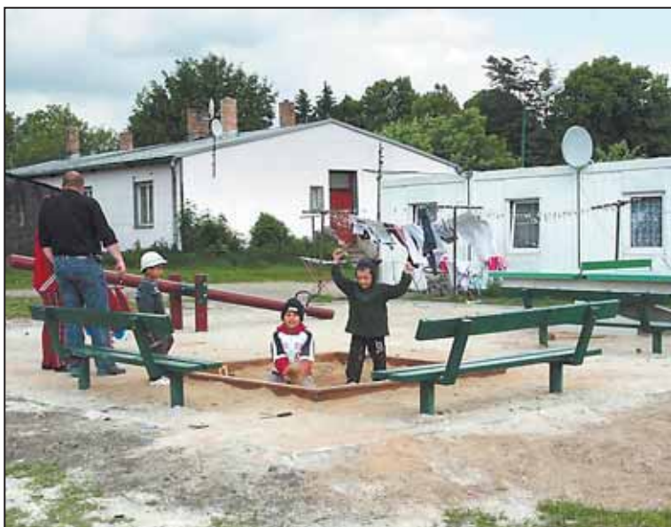
DĚTSKÉ hřiště v lokalitě „Havaj“ stálo 100 tisíc korun a je dalším z řady hřišť, která magistrát buduje po Jihlavě.

Jihlava loni vybudovala šest nových dětských hřišť nákladem pěti milionů korun, stejný počet bude vybudován i letos, další desítky starších hřišť město udržuje. Několik desítek nevyužívaných hřišť bylo v posledních letech zrušeno a zlikvidováno, obvykle na žádost obyvatel okolních domů nebo z provozních a bezpečnostních důvodů. -Im-