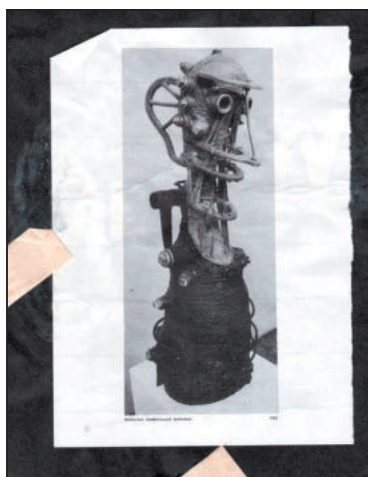
UKÁZKA rozpracovaného samizdatového časopisu Vysočinná. U obrázku je popiska: Neštovice - kombinovaná technika.

Slovinská vláda přijímá řadu ústavních dodatků, které jí umožní vystoupit z jugoslávské federace.