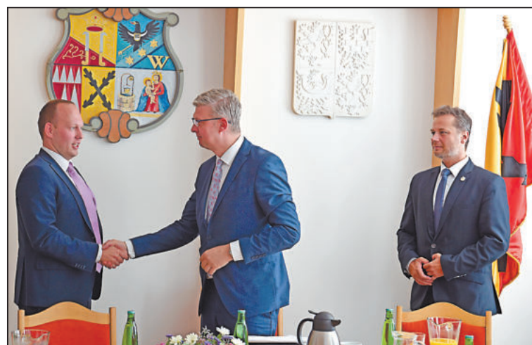
VICEPREMIÉR a ministr průmyslu a obchodu Karel Havlíček byl hostem na žďárské radnici. Reč byla o průmyslové zóně.

„Dohodli jsme se na spolupráci města a CzechInvestu a na konzultacích s Ministerstvem průmyslu a obchodu při administrativě a budování nové průmyslové