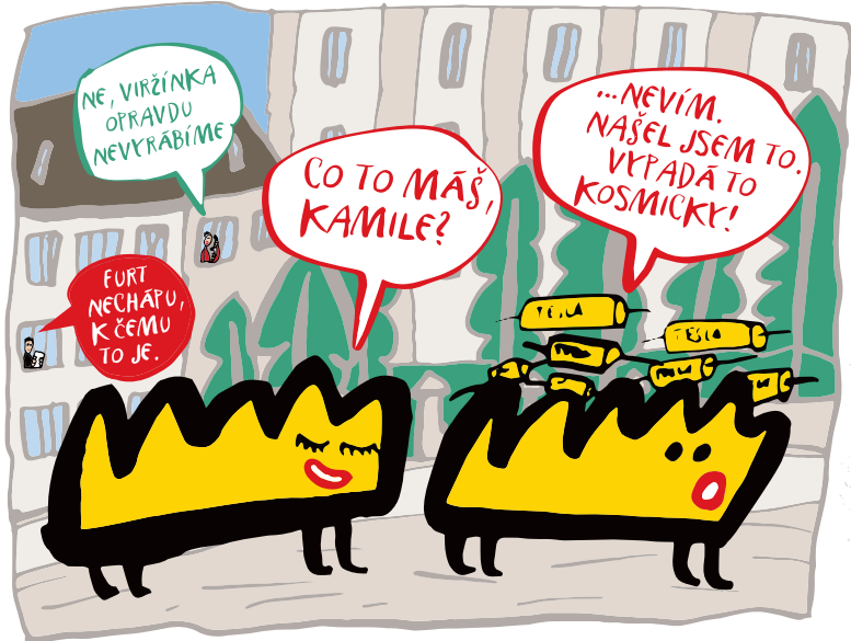
V ROCE 1958 ZAHĀJILA PROVOZ V MÍSTĚ „TABAČKY“ NA HAVLÍČKOVĚ ULICI TESLA JIHLAVA S VÝROBOU SVITKOVÝCH KONDENZÁTORŮ.