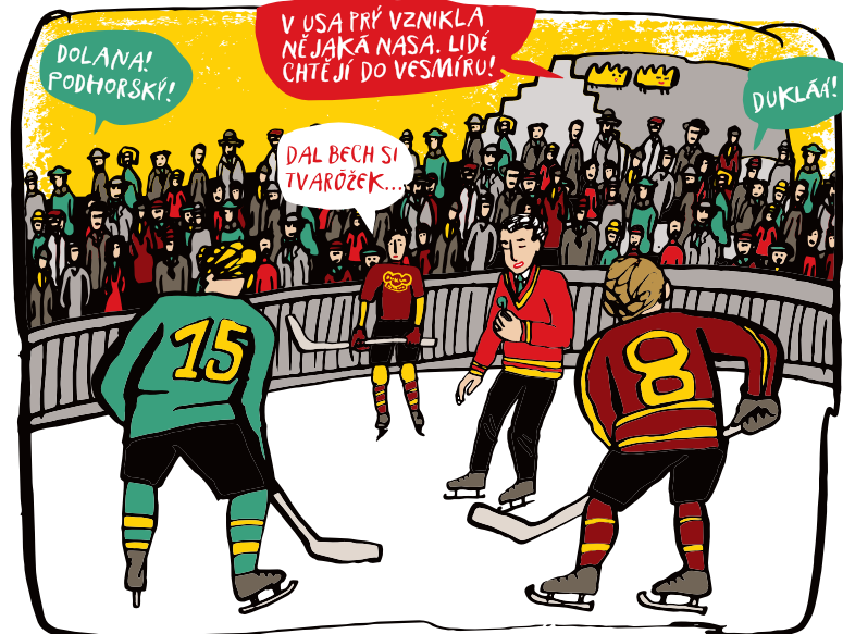
OD ROKU 1956 V JIHLAVĚ PŮSOBILA NA NOVĚM STADIONU (TEHDY BEZ STŘECHY) HOKEJOVĀ DUKLA, PŘESTĚHOVANĀ Z OLMOUCE. JIHLAVĀCI SI NOVÝ TÝM ZAMILovali A STADION SE PROMĚNIL VE SKUTEČNÝ KOTEL!